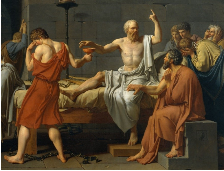
Sokrates, içmek için baldıran zehrini alırken