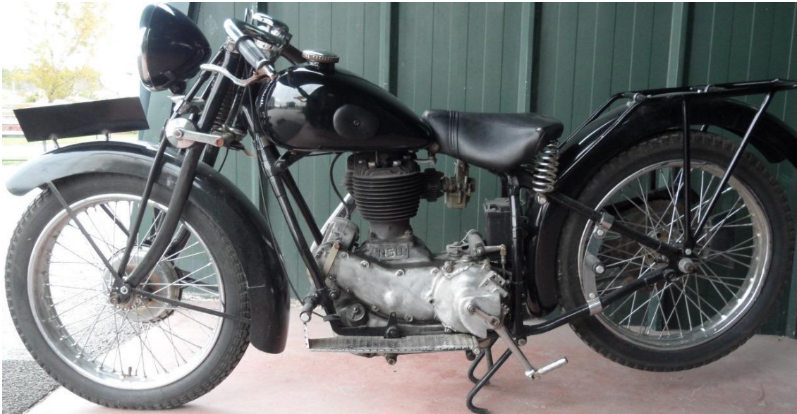
1931 Model NSU marka Alman motosikleti (ODT Bilim ve Teknoloji Mzesi)

retim yapamadı. Alman ekonomisi dzelmeye bařlayınca, NSU motosikletlerinin retimine yeniden bařlanıldı. Kısa srede NSU'nun retimi artırıldı ve 1955-1959 yılları arasında dnyanın en ok satılan motosikleti oldu. Bu motosiklet, saatte 322 kilometre hıza ulařan ilk motosiklet oldu. NSU motosikleti, 4 kez dnya motosiklet hız rekoru kırdı. NSU motosikletleri, 1930'lu yıllarda Trkiye'ye de satıldı. ODT Bilim ve Teknoloji Mzesi'nde bu motosikletlerden; biri 1931, dięeri 1933 model olan iki NSU motosiklet ile 1958 model bir BMW motosiklet sergilenmektedir. İkinci Dnya Savařı sona erince, lkelerine geri dnen ve iřsiz kalan ABD askerlerinin bazıları, ordudaki arkadaşlarıyla birlikte motosiklet kulpleri kurdu. Bunlar arasında adı en ok bilinen kulp, Cehennem Melekleri Motosiklet Kulb oldu. Bazı yeleri yasa dıřı iřlere bulařan bu kulb konu alan ve bařroln 1954'te Marlon Brando'nun oynadıęı The Wild One adlı bir sinema filmi evrilmiřti.