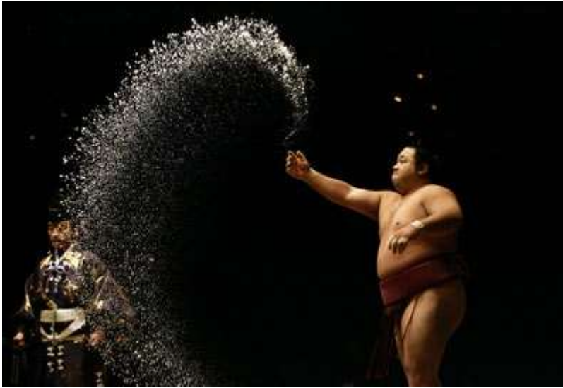
Kötü ruhları uzaklaştırmak için ringe tuz serpen sumo güreşçisi

Tuzun, tuzlu göl sularından üretilmeye başlanması 8.000 yıl öncesine uzanır. Çinliler'in M.Ö. 6.000'de Xiechi Gölü'nden tuz ürettiği biliniyor. Mısırlılar, M.Ö. 2800'de tuzlanmış balık ihraç ediyor ve ölüleri gömerken de yanlarına tuz koyuyordu. Tevrat'ta, yakılarak tanrıya kurban edilecek olan hayvan etlerine tuz atılması gerektiği yazılıdır. İncil'de 30 yerde tuzdan bahsedilir ve birinde İsa "sen dünyanın tuzusun" der. Tuz bazı kültürlerde kutsal sayılır ve yere dökülmemesine özen gösterilir. Yere tuz dökenler veya cenaze evinden dönenler sol omuzlarından arkaya doğru tuz atıp kötü ruhları uzaklaştırır. Budizm inancına göre tuz, kötü ruhları uzaklaştırdığı için sumo güreşçileri ringe tuz serper. Geçmişte, üretimi sınırlı olduğu için tuz çok değerliydi. Günümüzde yılda 210 milyon ton tuz üretildiği için fiyatı düşüktür. Tuz; deniz, tuz gölü ve kaya tuzu yataklarından üretilir. Kaya tuzu, kurumuş olan tuzlu göllerin kalıntısıdır ve yer altında derin tuz yatakları vardır. Neolitik dönemde (yeni taş devri) etin tuzlanarak saklanması keşfi, insanlara av dönemi dışında da et yeme olanağı tanıdı. Et ve diğer mevsimlik gıdaların tuzlanarak korunması sayesinde, dengeli beslenen insanların yaşamı kolaylaştı.