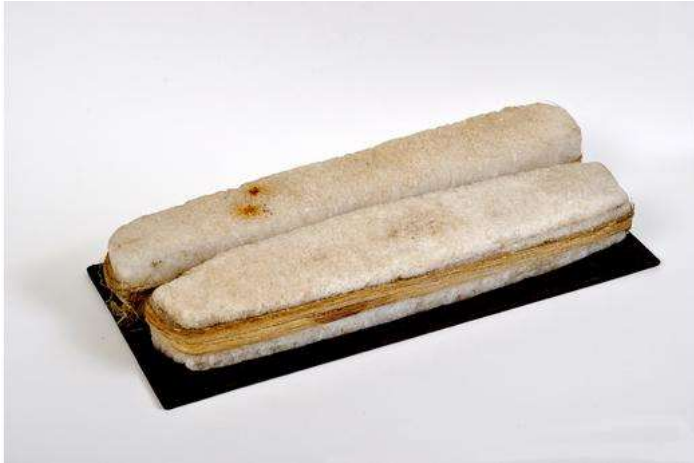
Habeşistan’da 1899’da bulunan ve para yerine kullanılan tuz blokları

döneminde askerlerin maaşı, bazen para yerine tuz verilerek ödenirdi. Bu nedenle geçmişte görevini iyi yapan askerlere “aldığı tuzu hak ediyor” denilirdi. İngilizce maaş kelimesinin karşılığı olan “salary” kelimesinin Latince tuz demek olan “sal” kelimesinden türediği sanılıyor. Roma İmparatorluğu’nda tuzdan alınan vergi önemli bir gelir kaynağıydı. Savaş zamanı tuza zam yapılarak gerekli para toplanırdı. Barış zamanı tuz ucuzlatılarak fakir halkın tuzsuz kalmaması sağlanırdı. Roma İmparatorluğu’nun ilk yıllarında Roma’ya tuz taşıyan arabaların kolay ve hızlı hareket etmeleri için özel bir tuz yolu (Via Salaria) yapılmıştı. Antik Yunan’da esirler tuz karşılığında satılırdı ve tembel köleler için “tuzun karşılığını veremiyor” denilirdi. Savaş dönemlerinde sefere çıkan orduların tuz bulamayışı sorunlara neden olurdu. Napoleon’un orduları, Rusya seferi sırasında yemeğe koyacak yeterli tuz bulamamıştı. Bu nedenle Napoleon’un binlerce askeri hastalanıp öldü. Gezgin Marco Polo, Tibet’te tuz bloklarına kralın silüetinin basılıp para yerine kullanıldığını yazmıştı. Tuz, M.Ö. 523’te Habeşistan’da para yerine kullanılıyordu.