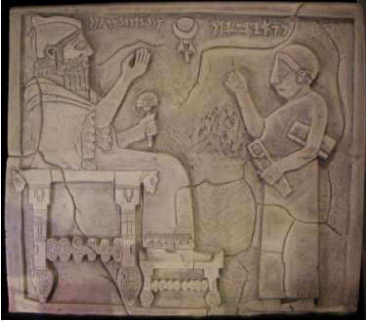
Kral Berrakip ve katip (Geç Hitit dönemi M.Ö. 750) ODTÜ Bilim ve Teknoloji Müzesi (replika)

Katipler, kralların devlet sırrı sayılan mektuplarını yazıp envanter tutacağı için onların güvenilir ailelerin çocuğu olması istenirdi. M.Ö. 2000'den kalan bir kil tablette 500 katibin adı ve baba meslekleri tespit edildi. Tümüünün babası zengin kişilerdi. Krallar okuma yazma bilmezdi, bu nedenle kralların mektuplarını okuyan ve yazan katiplerin bazen küçük hileler yaptığı biliniyor. Katipler bazen, kralın mektubunun altına mektubun gönderildiği kralın katibi için gizli mesaj yazardı. Örneğin bir kral mektubunda, katibin karşı taraftaki katibe "bana koyun yollayacaktın ama hala gelmedi" yazdığı biliniyor. Okuldaki hocalar genellikle rahipler ve katiplerden oluşurdu. Öğrencilere okuma yazma dışında matematik de öğretilirdi. Sümer ve Hititler'de sayı sistemi 60 tabanına göre idi, ağırlık birimi de "şekel"di (1 şekel=12.8 gram). Bir "mina" da 60 şekele eşitti. Sarayda fal bakmak ve hastalık tedavi etmek için eğitilmiş kişiler vardı. Okullar sarayın bulunduğu başkentteki mabetlerin yakınında olurdu. Hititler'in Hattuşuş dışında da katip okulları açtığını açıklayan bilim adamları var.