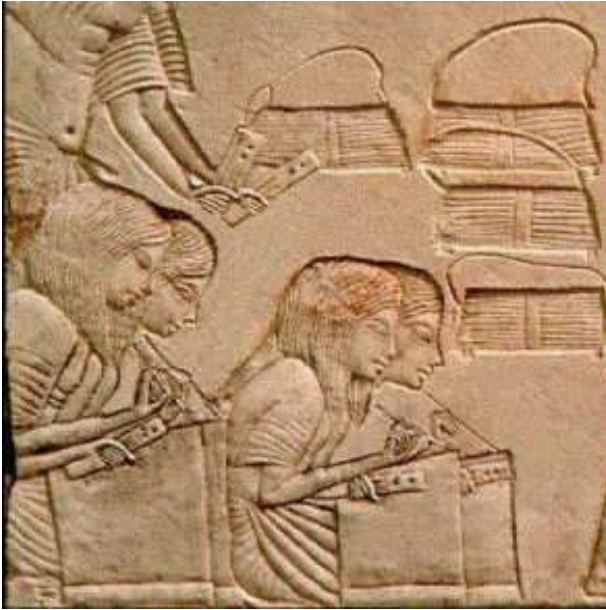
Mısır'da katipler (Taş kabartma)

Kil ıslak olduğu için hataları silip düzeltmek kolaydı. Öğrenciler tecrübe kazandıkça kopyaladıkları metinler zorlaşırdı. Son aşamada öğrencilere kitaplar kopyalatılırdı. Öğretmene saygı göstermeyen veya ödevlerini yapmayanlara sopayla vurularak ceza verilirdi. Bazı velilerin, öğretmene rüşvet vererek çocuklarını okulda rahat ettirdiği biliniyor. S. N. Kramer'in tercüme ettiği Sümer tabletinde "...Baba çocuğun dediklerini önemsemi ve öğretmeni eve getirip başköşeye oturttu... çocuk babasına okulda öğrendiklerini anlattı... ziyefetten sonra... baba öğretmeni giysilerle donattı hediye verdi parmağına yüzük taktı..." yazmaktadır. Tablet öğretmenin çocuğa dua etmesiyle biter. Başka bir kil tablette "..öğretmen başıma vurdu ve bilgiler kafama girdi." diye yazar. Bir Sümer bilmecesi: "O ev ki cennet gibi... Gözü kapalı biri oraya girdi, gözü açılmış olarak çıktı" cevap: "okul". Sümer okullarında velilerin ne kadar ücret ödediği bilinmiyor. Hititler, okula gönderilen her öğrenci için öğretmene 6 shekel ücret öderdi.