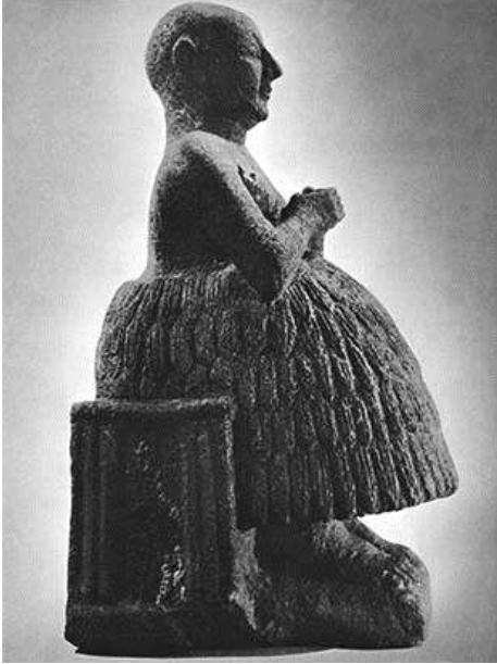
Sümer döneminde bir katip (M.Ö. 2400)

Yazının keşfinden önce, erkek çocuklar avlanma, yiyecek toplama ve saldırganlardan korunmayı, kızlar ise ev işlerini öğrenirdi. Yaşlılar, çocuklara efsaneler, ilahi, şiir ve bilmece ezberletip pratik bilgiler öğretirdi. Sümerler M.Ö. 3200'de yazıyı keşfedince, krallar tahıl ve canlı hayvanların kayıtlarını daha iyi tutmaya başladı. Krallar yasa ve önemli kararlarını da yazıya döktü. Rahipler dini bilgileri yazılı hale getirdi. Krallar için yeterli sayıda katip yoktu. Dini kurallar, dua ve ilahiler ile törenlerin düzenini kayda geçirmek için mabetlerde de katiplere ihtiyaç doğdu. Sümerler katip yetiştirmek amacıyla dünyanın ilk okullarını kurdu. Sümerler'in ardından Mısırlılar ve Hititler de devletin önemli yazılarını yazdırmak için mabetlerin yakınında veya bitişiğinde katip okulları açtı.