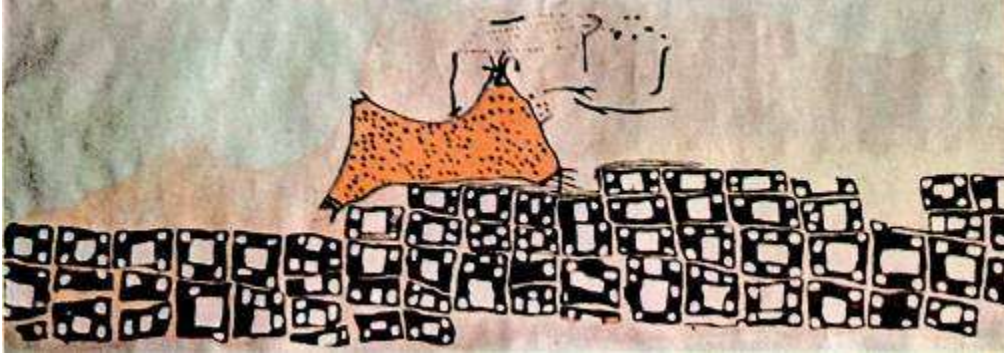
Çatalhöyük'te bir evin duvarındaki haritada köy ve Hasan Dağı (kopya)

bu sorunlara karşın Türkiye'ye olan sevgisini kaybetmedi. İngiltere'de 2005'e kadar öğretim üyeliği yaptı ve 29 Temmuz 2012'de İngiltere'de öldü.