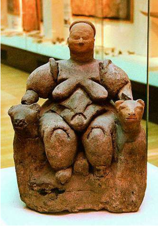
Mellaart'ın bulduğu ana tanrıça heykelciği (Anadolu Medeniyetleri Müzesi)