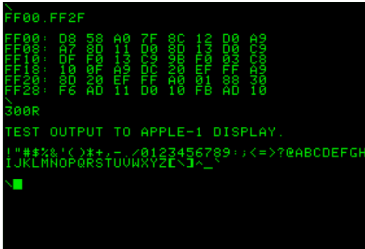
Apple-I'in ekranı (1976)