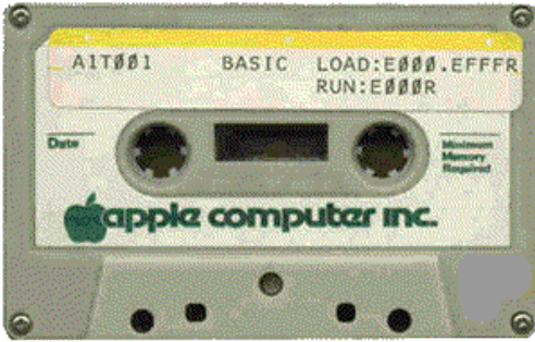
Apple-I'in program yükleme kaseti