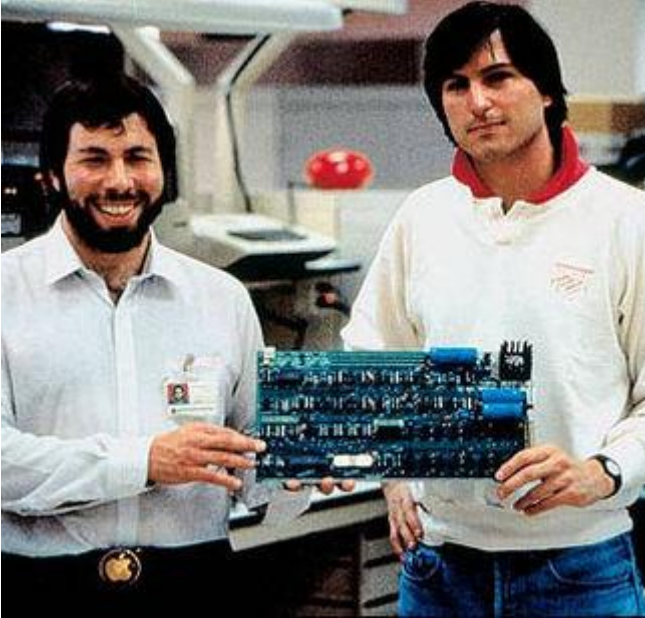
Steve Wozniak (solda) ve Steve Jobs Apple-I ile

Ailesi Polonya kökenli olan Wozniak, 11 yaşında amatör telsizci oldu. Lisede, bilgisayara yöneldi ama ailenin bilgisayar alacak gücü yoktu. O da, paramız yoksa, bilgisayarımı kendim yaparım diyordu. Lisede, telefonda bedava konuşma yapılan, bir cihaz üretilip satıldı. Wozniak, 1968'de elektronik ve bilgisayar meraklısı olan Steve Jobs ile tanıştı. Jobs, yakında oturan bir ailenin evlatlığıydı. Wozniak, 1975'te maddi nedenle, üniversiteye ara verip Hewlett Packard şirketinde teknisyen oldu. Televizyona bağlanarak oynanan, bilgisayar oyunu üreten Atari'nin, üreticisiyle tanıştı. Onlara bir bilgisayar oyunu tasarlayınca, Atari iş teklif etti ama Wozniak, eski şirketini bırakmadı.