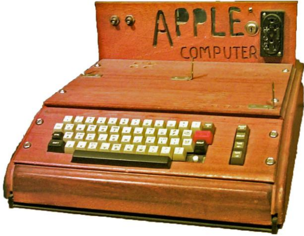
Ahşap gövdeli Apple-I bilgisayar (1976)