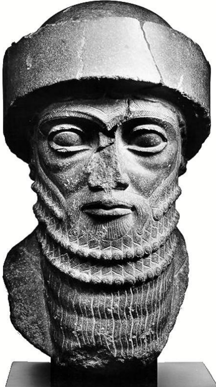
Hammurabi'nin büstü (Louvre Müzesi)

Babil halkı, geçmişte Amoriler olarak bilinen göçebe bir topluluktan ve M.Ö. 3. bin civarında Suriye kıyılarından Babil'e gelip yerleştiler. Kısa sürede güçlenen Amoriler, M.Ö. 1900'lerin sonuna doğru kentin yönetimini ele geçirdi. Hammurabi'nin babası Sin-Muballit, Babil kralıydı ve küçük krallığını geliştirip modernleştirdi. Ancak Babil'in güneyindeki Larsa Krallığı ile girdiği savaşı kaybedince yaşlı ve hasta olduğu gerekçesiyle krallıktan feragat etti. Oğlu Hammurabi, M.Ö. 1792'de tahta çıktı. Hammurabi iç ve dış politikayı çok iyi bilen, kurnaz bir kraldı. Önce kenti çevreleyen surların yüksekliğini artırdı, tapınakları yeniledi ve gösterişli yeni tapınaklar yaparak halkın sevgisini kazandı. Bir yandan ordusunu güçlendirirken diğer yandan babasının savaş yaptığı Larsa kralına dost gibi yaklaştı ve onunla ittifak yaptı. İran kökenli Elamlılar, Mezopotamya'nın orta kısımlarını ele geçirdince Hammurabi, Larsa kralını ikna edip onunla birlikte Elamlılar'a saldırdı ve savaşı kazandı.