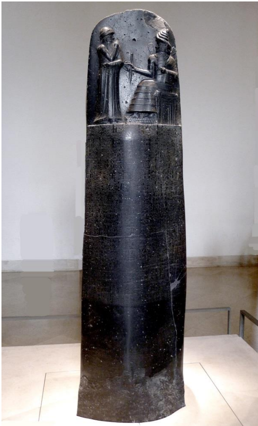
Hammurabi yasalarının yazılı olduğu dikili taşta Hammurabi (ayakta) ve adalet tanrısı Shamash'ın kabartması (Louvre Müzesi)

krallıkları da ele geçirdi. Hammurabi, babasını yenmiş olan Larsa Krallığı'na saldırıp orayı da ele geçirince asıl hedefi olan Basra Körfezi'ne ulaştı. Hammurabi, güney kısımdaki kentlere saldırmadan önce yaptırdığı barajların kapaklarını kapatıp kentleri susuz bırakarak teslim alırdı. Kent teslim olmazsa baraj kapaklarını açıp kenti sel altında bırakarak kenti ele geçirirdi. Hammurabi güney kentlerini ele geçirirken kuzeydeki Mari ve Yamhad kent yöneticileriyle işbirliği yapmıştı. Güneyi tümüyle ele geçirince kuzey komşularıyla da antlaşmaları bozup onların topraklarını da ele geçirdi. Kuzeyde Diyarbakır'a kadar geldiğini gösteren bir yazılı taş (stel) bulundu. İmparatorluğun her yerine ulaşan yollar yaptı, haberleşme için posta sistemi oluşturdu ve iç düzeni sağlamak için de polis teşkilatı kurdu. Ülkeyi rahat yönetmek için bazıları çok sert ve acımasız olan yasaları hazırladı.