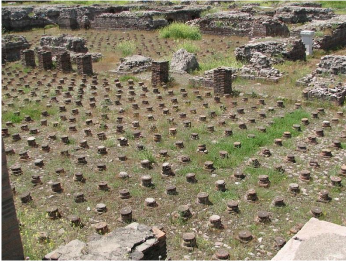
Ankara'daki Roma hamamının kalıntıları (M.S. 3. yüzyıl)

hamamlar çok büyüktü ve halk ücret ödemezdi. İmparatorluk hamamlarına “Thermae” denilirdi ve imparatorun gücünü gösterdiği için büyük ve mimari açıdan mükemmel yapıları. İmparatorluk hamamları, kent dışındaki arazilerde inşa edilir ve içinde kütüphane, oyun alanları ve çevresinde gezinti bahçeleri olurdu. Küçük hamamlara kadınlar sabah, erkekler de öğleden sonra giderdi. İmparatorluk hamamlarında kadın ve erkekler için ayrı giriş kapıları ve bölmeler olurdu. Zenginler hamama kölelerini getirip banyo sırasında hizmet ettirdiği için büyük hamamlarda, kölelerin de bir giriş kapısı olurdu. Hamamın girişindeki soyunma odasında, elbiselerin bırakıldığı nişler vardı. Soyunma odasından soğuk odaya (frigidarium) geçilip soğuk su havuzuna girildikten sonra ılık odaya (tepidarium) geçilip terlenir ve masaj yaptırılırdı. Ardından sıcak odada (caldarium) sıcak suyla banyo yapılır ve soğuk odaya dönülüp masaj yaptırılırdı.