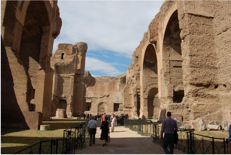
Roma'daki Caracalla Hamamı'nın kalıntıları (M.S. 216)

Hitit İmparatorluğu'ndan yüzlerce yıl sonra Yunanistan'da ilk hamamlar ortaya çıkmaya başladı. Halk önceleri pınar başlarında ve sıcak su çıkan kaplıçalarda banyo yapardı. Bazı pınar ve kaplıcaların tanrılarca kutsandığına ve bu nedenle o suların şifalı olduğuna inanılırdı. Yunanlılar, önce şifalı suların çevresine, ardından da spor salonlarının yanına hamamlar yaptı. Atletler, kasları gevşettiği için spordan sonra hamamda sıcak suyla banyo yapmayı tercih ederdi. Banyodan sonra vücutlarına kokulu yağlar sürerlerdi. Sadece temizlenmek amacıyla olanlar da vücuda canlılık verdiği için soğuk suyla banyo yapardı. Kadın ve erkekler farklı zamanlarda hamamı kullanırdı. Hamamda genellikle serinletici içecekler içilirdi. Sokrates döneminde, erkeklerin sık sık hamamda sıcak suyla yıkanması hoş karşılanmaz müsriflik sayılırdı. Halk hamamları devlete aitti ve girişte az bir ücret ödenirdi. Ayrıca zengin kişilere ait özel hamamlar da vardı. Hamamda sabun yerine; kil, soda, kül, yağ veya sabun otu kullanılırdı. Bazı hamam resimlerinde atletlerin, daire şeklinde yüksekçe bir kurnanın etrafında ayakta durup kurnadan tasla su alıp yıkandığı görülür. Hamamda soyunma odasından elbise çalanlar ölüm cezasına çarptırılırdı.