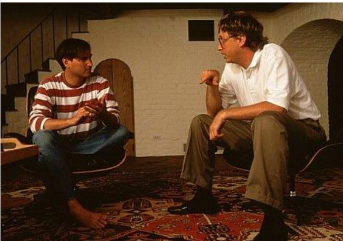
Steve Jobs ve Bill Gates ilk yıllarda

Jobs, Pepsi Cola'dan getirdiği başkanla anlaşmazlığa düştü ve 1985'te hisselerini satıp Apple'ı terketti. Önce, NeXT adlı bilgisayar şirketini kurdu ve Pixar adlı animasyon şirketini satın aldı. NeXT'in ilk bilgisayarını 1989'da satışa çıkardı. Bilgisayar tutulmayınca üretimden vazgeçip yazılıma döndü. Jobs, Walt Disney için "Tin Toy" animasyon filmini yaptı. Gişe rekoru kıran film, 1995'te Oscar Ödülü kazandı. Yüksek hasılatlı 3 animasyon filmi daha yaptı.